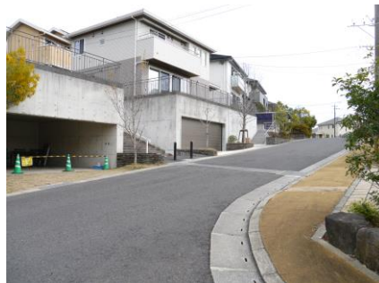
② 大和台入口 横断歩道がない