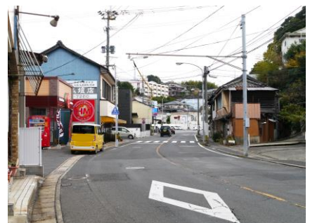
⑥ ほっともっと前 信号のない横断歩道