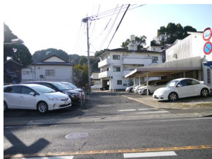
⑤ 原田興産横 夜暗く人通りが少ない 道がせまく車両の通行に注意