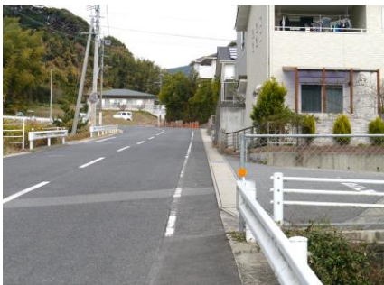
① 春陽台横 路側帯がせまく交通量が多い