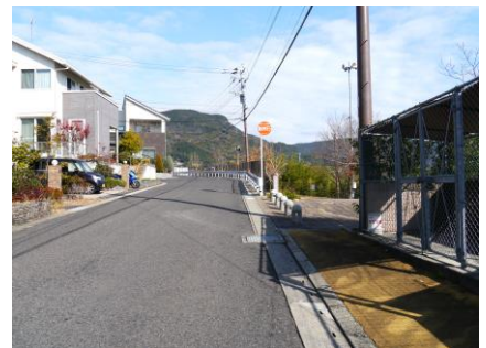
③ 大和台公園前 横断歩道がない