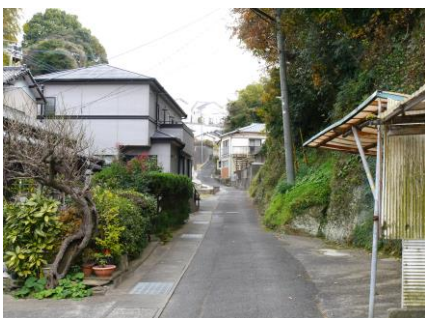
④ 夜暗く人通りが少ない